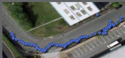
Обработка данных Google Earth™